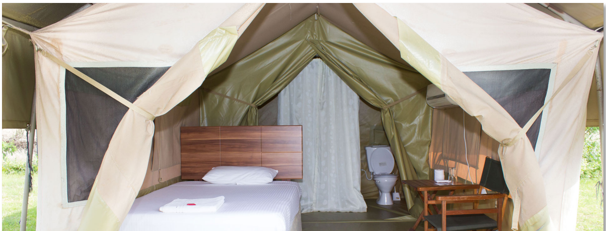
Övernattning i Magadi Safari Camp